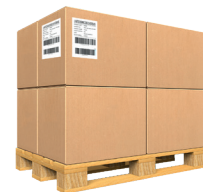
APL 60S 2 ETIQUETAS 3 palets/min*

Due to our continuous improvement policy, our product specifications are subject to change without notice.